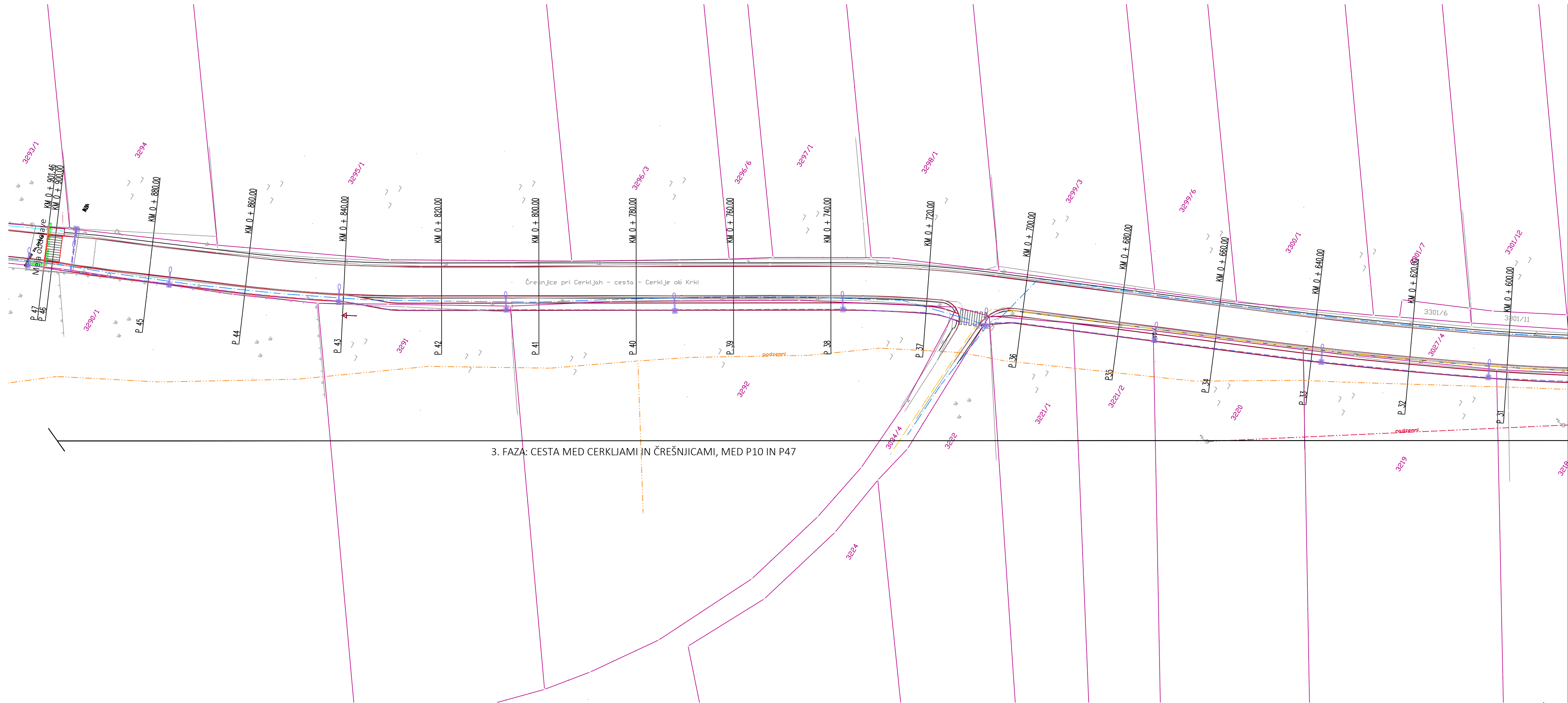
3. FAZA: CESTA MED CERKLJAMI IN ČREŠNJCAMI, MED P10 IN P47